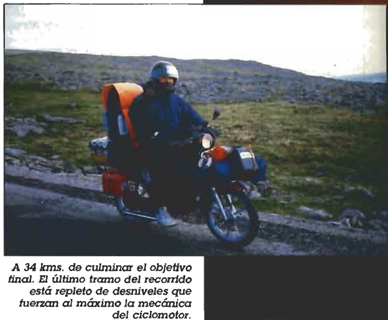
A 34 kms. de culminar el objetivo final. El último tramo del recorrido está repleto de desniveles que fuerzan al máximo la mecánica del ciclomotor.

O s podéis imaginar lo que se siente cuando a 80 kms. de casa, justo al cruzar Girona tenéis la desagradable sensación de haber pinchado.