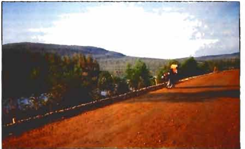
Un viaje de tanto días de duración y con un recorrido tan variado da oportunidad no sólo de conocer lugares de sobrecogedora belleza, sino también personas de singular interés por su diversa condición.

da más de sí en los últimos metros ¿Quién lo diría?, motorizado y jadeando. A pesar de que ya me había avisado, sentí una gran decepción al llegar a lo alto de la llanura y encontrarme el paso controlado por un peaje -65 KN, unas 1.200 ptas.- y tras él centenares de autocaravanas, pero la decepción duró poco, hasta que me dirigí hacia el parking destinado a las motos y coloqué mi Vespino entre las más modernas Trail o Maxi-Bikes. No lo podía creer, estaba en Nord Kapp, y los demás turistas tampoco se lo podían creer, así que una infinidad me pedían que posase para sus cámaras fotográficas o vídeos, algunos me hacían coger del brazo a su mujer para fotografarnos, y entre tanto movimiento, me parece oír algunas