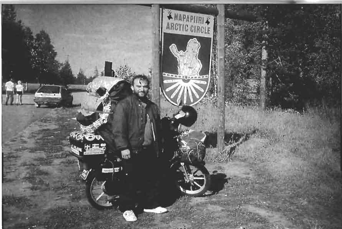
Finlandia. Uno de los puntos más anhelados del viaje. La primera visión de la Laponia salvaje resulta ciertamente impresionante.

Tras 2.200 kms. y 12 días de ruta, soportando muchísimo calor, viento, lluvia y granizo, creo que "Pinky" (mi Vespino) se merecía esta limpieza y un poco más de atención diaria. Al día siguiente los 250 kms. que recorrí me llevaron a Frederikshavn;