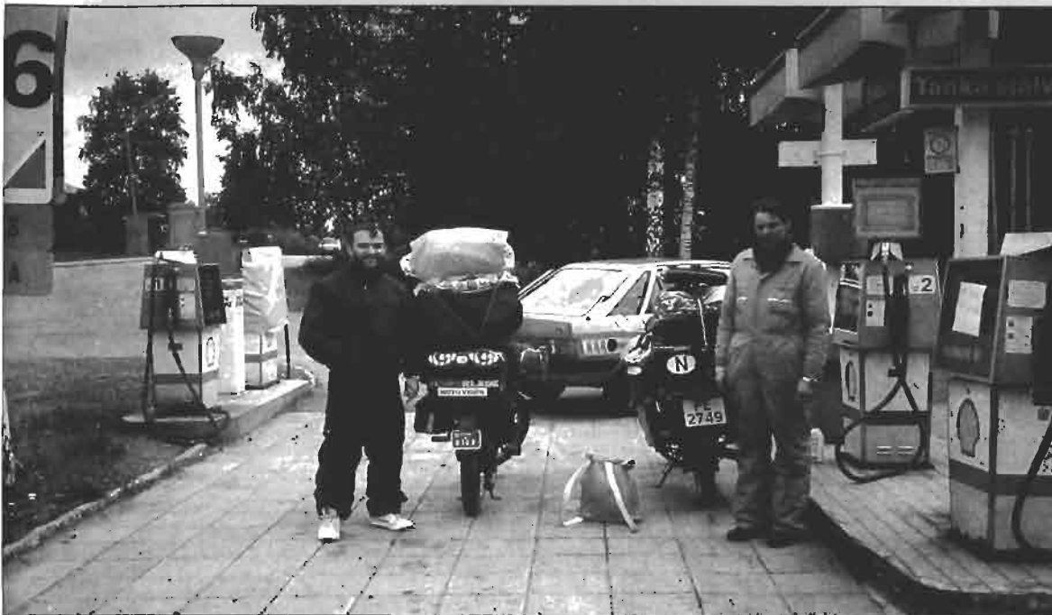
Este noruego de 50 años, lleva 25 años realizando viajes con ciclomotor. Para esta ocasión utilizó un japonés de seis marchas. Miles de renos cruzan a diario estas carreteras, aportando así una nota más de exotismo a la ruta.